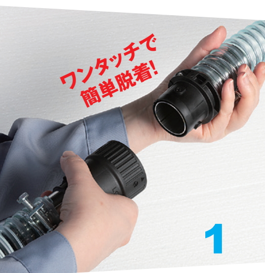
ソケット側のカプラをプラグ側のホースに挿入します。