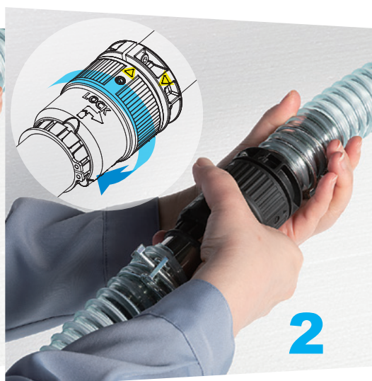
「LOCK」の矢印方向へソケット側のカプラを回転させます。