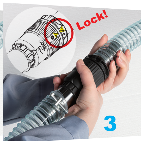
▲印同士が合う位置まで回転させると、ロックが掛かって外れなくなります。